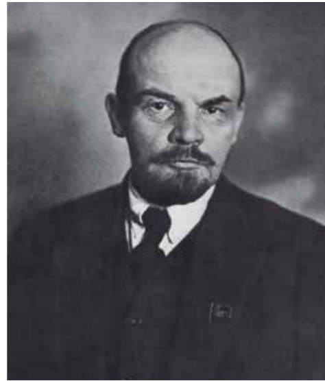
Vladimir Ulianov - Lênin

me refiro aos anos em que houve a coletivização forçada pelo Stalin, que assumiu o comando da União Soviética e impôs esse sistema amarrado que estou mostrando para vocês.