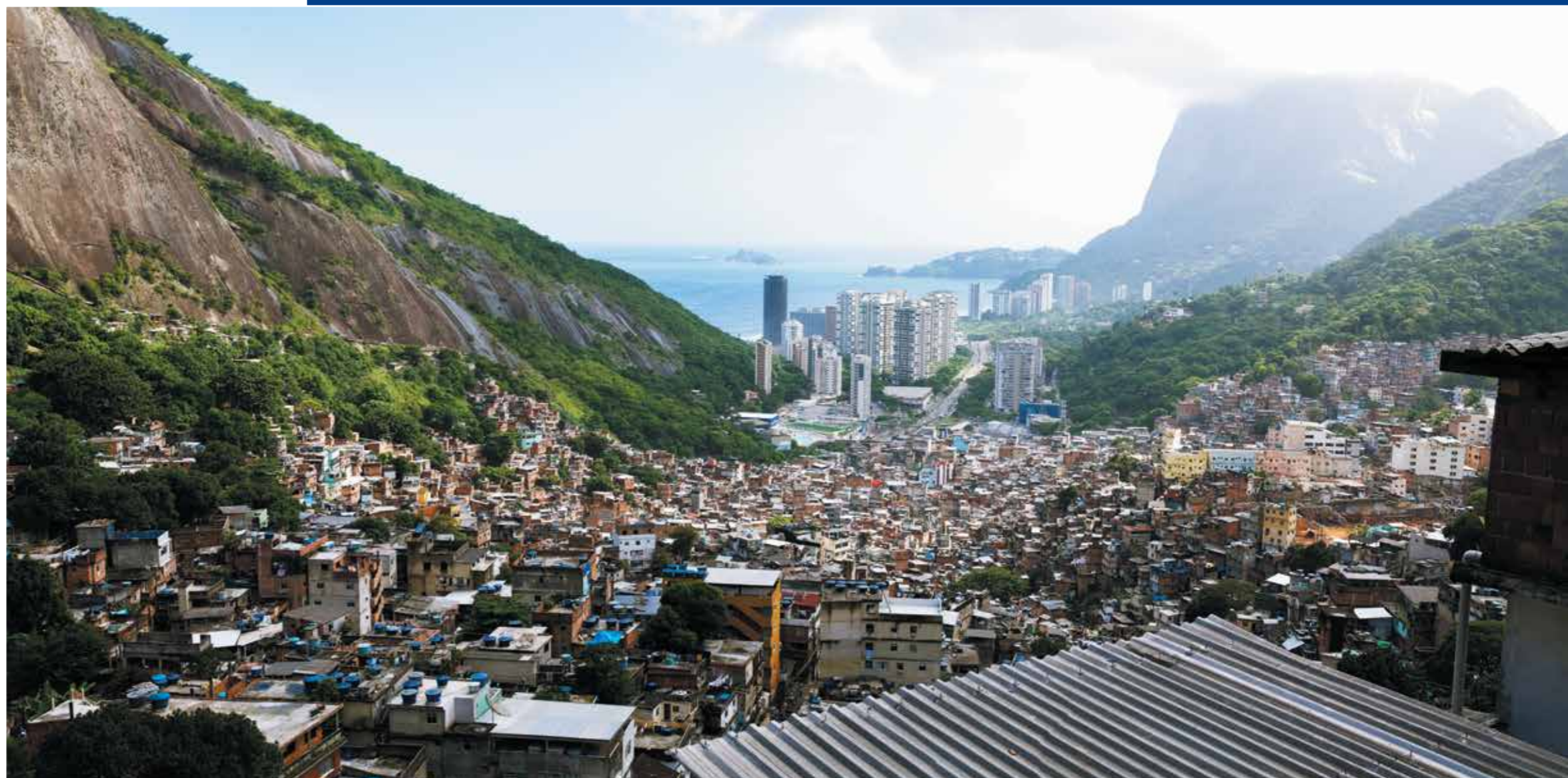
FAVELA DA ROCINHA

E isso é um outro ponto que a gente pode falar um pouco depois, um ponto que está na origem desse problema, a questão da correção policial, do controle externo, que aqui no Rio também, historicamente, é um problema. Mas, enfim, o fato é que, no caso dele, essas ocorrências nunca geraram nenhum tipo de punição. Às vezes, até geravam processos judiciais. Ele foi réu por alguns desses crimes, respondeu à Justiça e acabou absolvido depois.